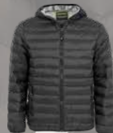
LIGHTER JACKET, JUNIOR

Art. nr: 21014 Kvalitet: 100% Polyester Strl: 34 - 48 Färger: Svart med silverfärgat foder Pris: 549:-