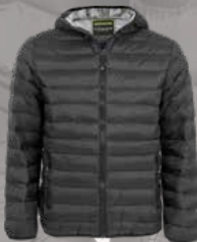
LIGHTER JACKET, MEN

En mjuk och bekväm lättviktsjacka i smidigt material. Frontfickor med dragkedja. 2st öppna innerfickor