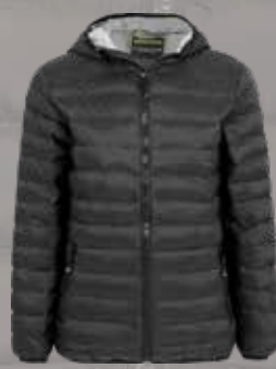
LIGHTER JACKET, LADY

Art. nr: 21013 Kvalitet: 100% Polyester Strl: XS - 4XL Färger: Svart med silverfärgat foder Pris: 549:-